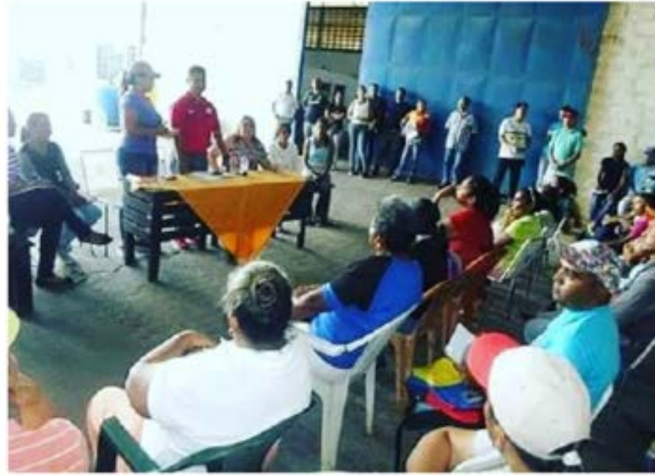
Con la finalidad de llevar a buen término el desarrollo de la harina de trigo panadera