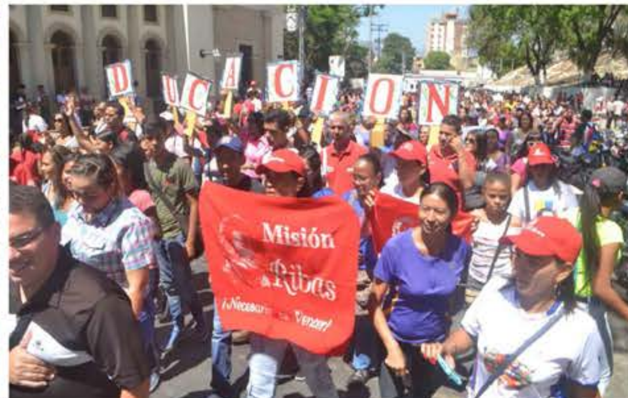
El sector educativo demostró que el Pueblo Unido Jamás Será Vencido