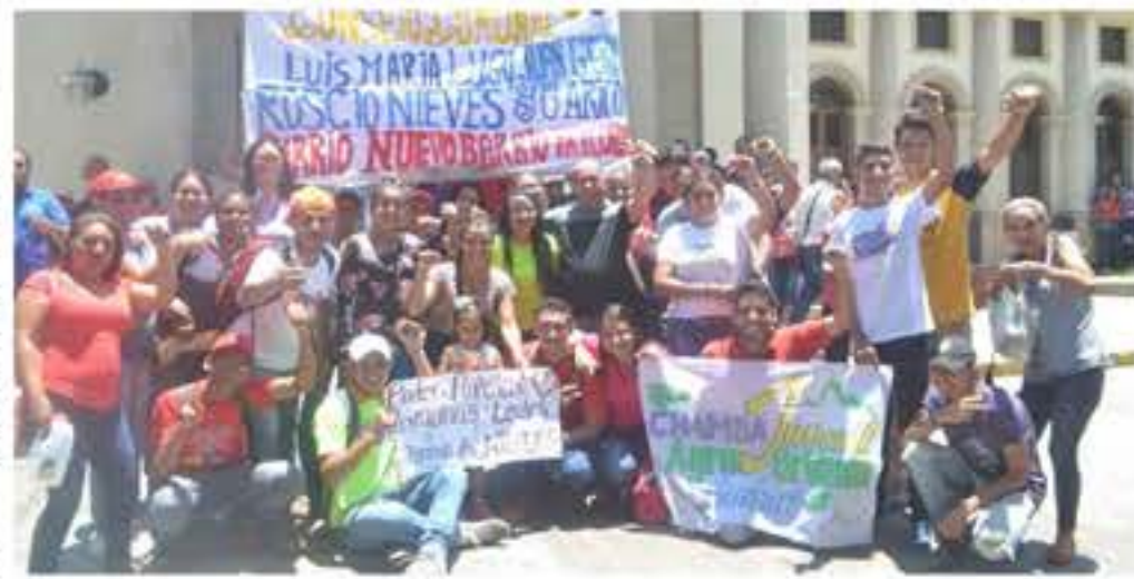
Secretario General de Gobierno junto al Poder Popular garantiza la paz y tranquilidad de la población

Nicolás Maduro está allí, porque el pueblo lo eligió el pasado 20 de mayo en elección popular, libre y democrática. Puntualizó que Venezuela, con su derecho a la autodeterminación, es una nación que se mantiene a la vanguardia para defender su soberanía e independencia;