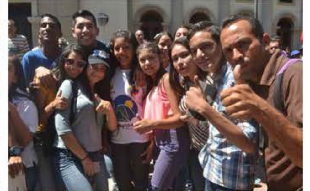
Juventud de oro rodilla en tierra por la defensa de la paz y la soberanía nacional