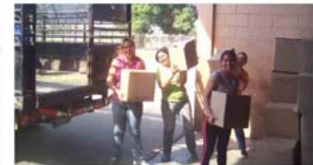
El Mandatario local enfatizó que en la jurisdicción se trabaja en articulación con los CLAP

Con el firme compromiso de garantizar el acceso del pueblo a los alimentos, el Gobierno Revolucionario atendió con módulos de alimentación a través de los Comités Locales de Abastecimiento y Producción (CLAP), a familias del municipio Esteros de Camaguan, dando continuidad al ciclo de distribución del alimento mediante cajas CLAP en las comunidades de esta jurisdicción. En esta oportunidad, el municipio fue favorecido por el Gobierno Revolucionario y al mismo tiempo siendo protegidos por los flagelos que trae la Guerra Económica, como el bacheo, especulación y sobreprecio.