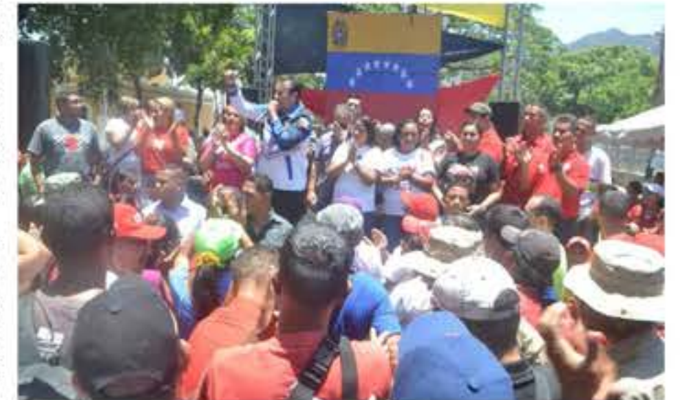
Equipo de Gobierno en la calle demostrando que son mayoría y que no se doblegarán ante las amenazas del imperio