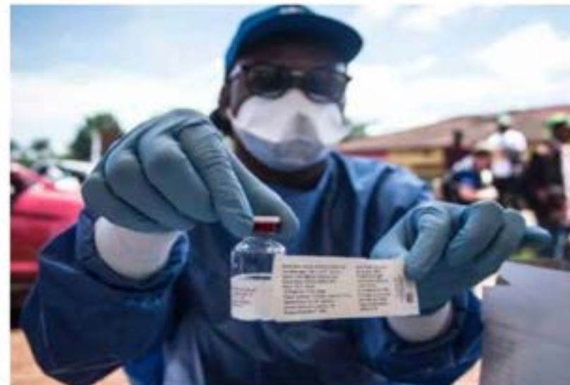
está empezando a dar resultados", expresó Dujarric. El brote de ébola es el más alto de la historia del Congo y el

"La agencia reporta que un reciente cambio en la estrategia de respuesta para promover un mayor compromiso y titularidad de las comunidades afectadas