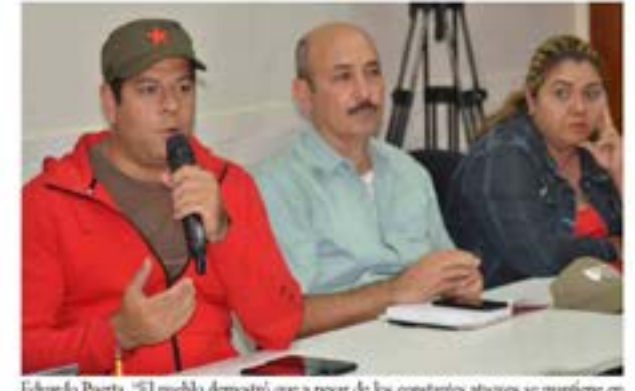
Eduardo Puerta, "El pueblo demostró que a pesar de los constantes ataques se mantiene en pie firme en defensa de la soberanía nacional"