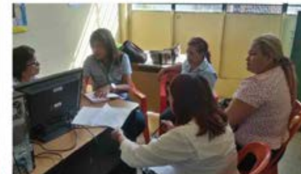
Instalaciones del estado participaron en la reunión para la reactivación de Entidad de Atención al servicio de la población infantil