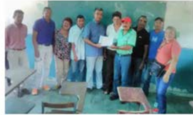
Concejos Comunales recibieron certificado de asistencia

contraloría social, acciones y funciones legales de un Concejo Comunal en la ruta de la construcción de las comunas." Destacó la importancia del equipo político quienes han fortalecido a nuestros voceros y nuestras vocerías en el marco del conocimiento de las leyes y aspectos importantes sobre