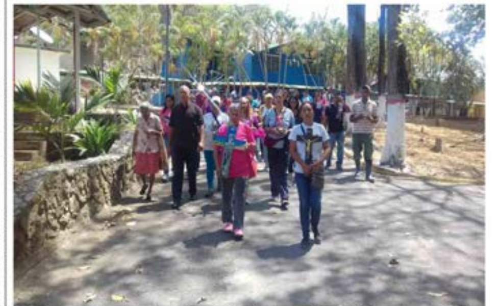
Durante el viacrucis participaron trabajadores y trabajadoras del Hotel y Spa Aguas Termales así como habitantes de los sectores aledaños

guariqueño, la suprema felicidad y paz posible. Finalmente, es propicio recordar las palabras del comandante supremo Hugo Rafael Chávez Frías, quien hacía referencia que Jesús estaba con los Pobres y era Revolucionario, y en este proceso el Mandatario Nacional y Regional esta junto a su pueblo. /jab