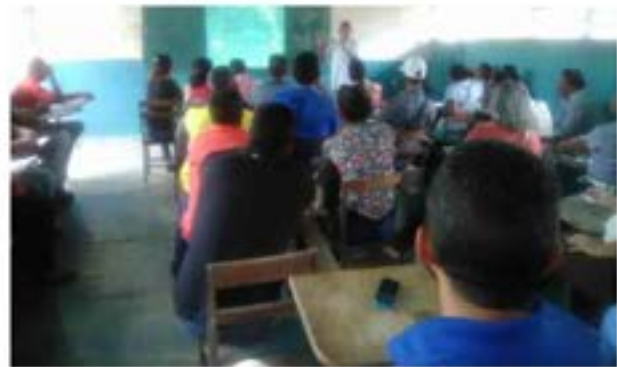
En la sede de la Milicia Bolivariana se realizó la socialización