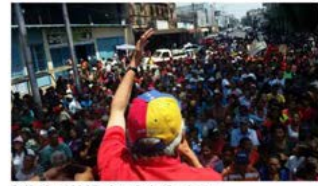
Pueblo del municipio Miranda atendiendo al llamado a la patria

calles, apoyando a los cuerpos de seguridad, contrarrestando a los quemadores de caucho que quieren causar terror, a quienes los decimos, fuera los terroristas de este pueblo, fuera los terroristas del Guárico, fuera los terroristas de nuestro país, no se equivoquen apóritas, porque Hugo Chávez nos enseñó que a Venezuela la cargamos en el corazón". /jfb