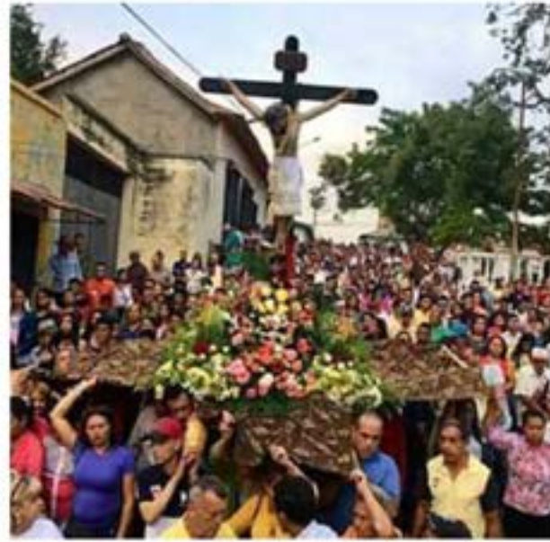
Religión del zaraceño adoración al Cristo de la Salud