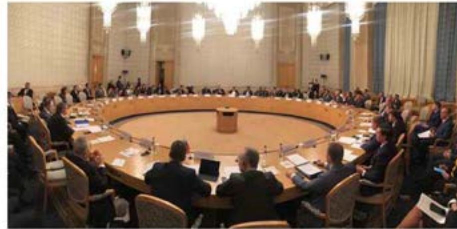
Comisión Intergubernamental de Alto Nivel Rusia-Venezuela que se realiza en Moscú.

Dicho encuentro que se realiza en el marco de la XIV