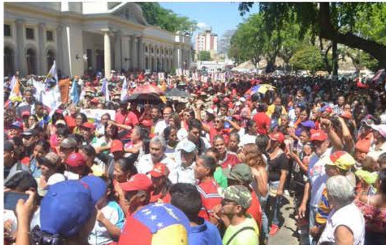
Fuerzas vivas de la Revolución se mantienen desplegadas en todo el territorio guariqueño en defensa de la paz y soberanía