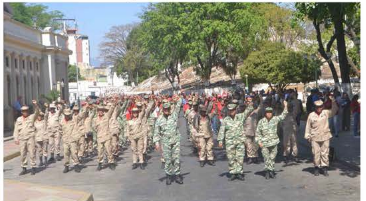
Cuerpo combatiente de la Milicia Bolivariana preparando y organizado por la defensa del territorio nacional