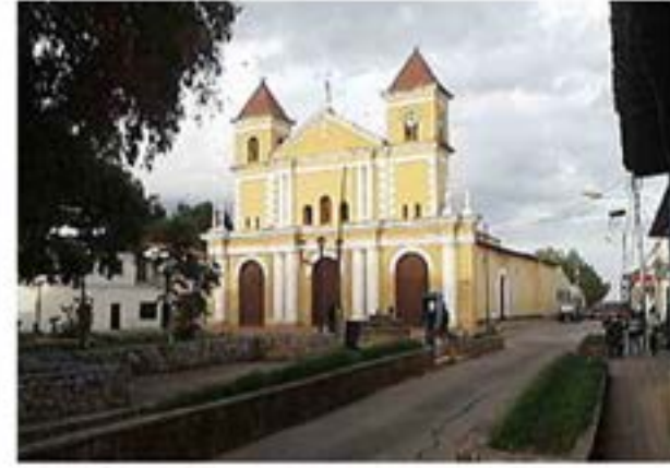
La ciudad de Zaraza cumple 166 años de fundada